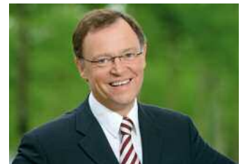
Stephan Weil

Weil sieht die Position der Amtschefs durch die auf acht Jahre verlängerte Amtszeit als zu stark an und plädiert für die Rückkehr auf fünf Jahre. Dann würden Stadt- oder Kreistage wieder mit den Amtsinhabern gewählt, was der Beteiligung nützen würde. In Hannover werde 2011 der Rat, aber nicht der OB gewählt, so Weil weiter, was die Beteiligung nicht verbessern werde. Weil will nun bei SPD und Regierung für den Erhalt der Stichwahlen werben. sg